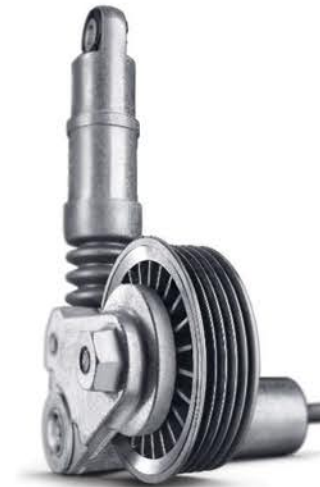
Tensor de accesorios