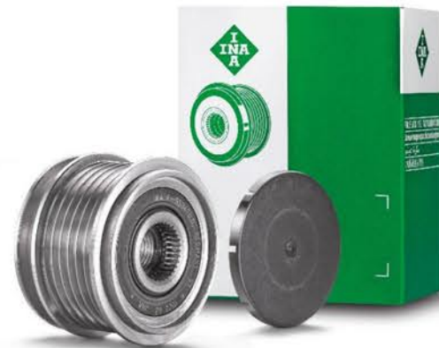
Polea de giro libre OAP