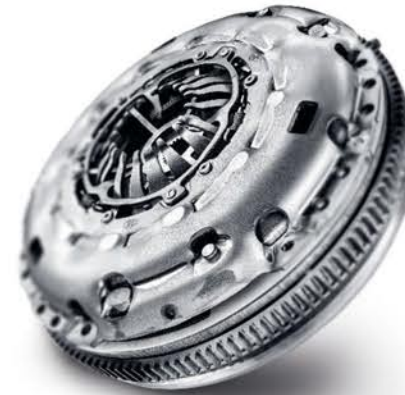
Volante Bimasa Compacto