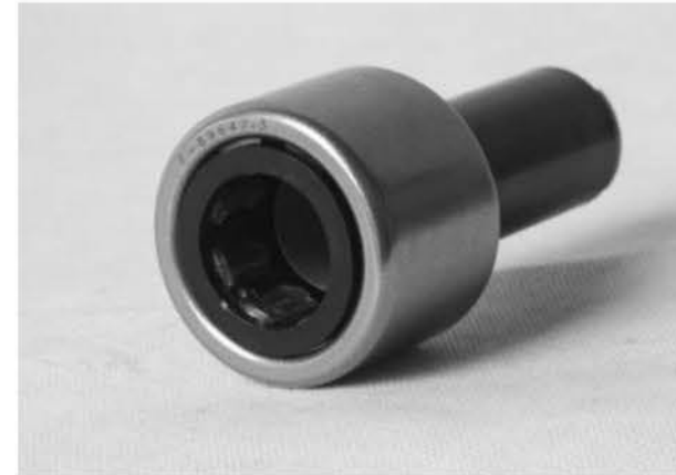
Guia de directa