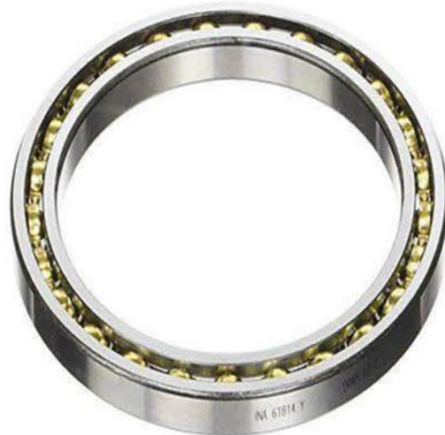
Componente de caja y diferencial (Linea pesada)