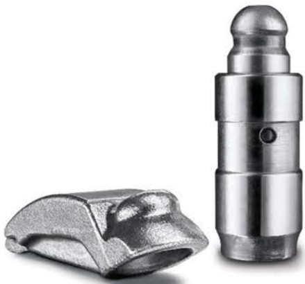
KIT Balancin + Pivot