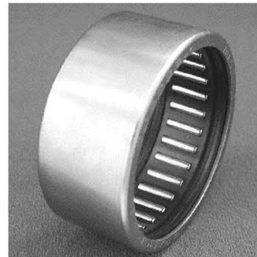
Buje de aguja