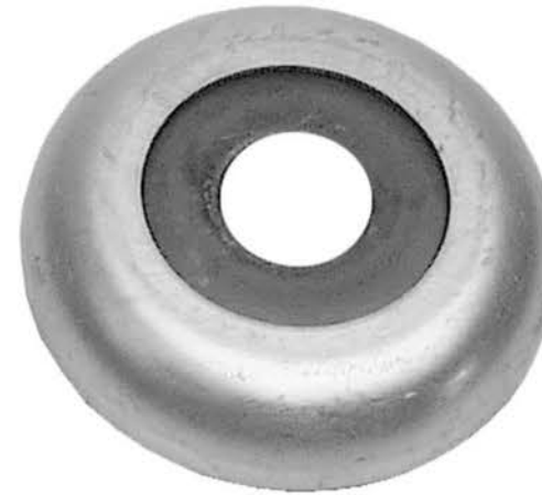
Rodamiento de suspensión