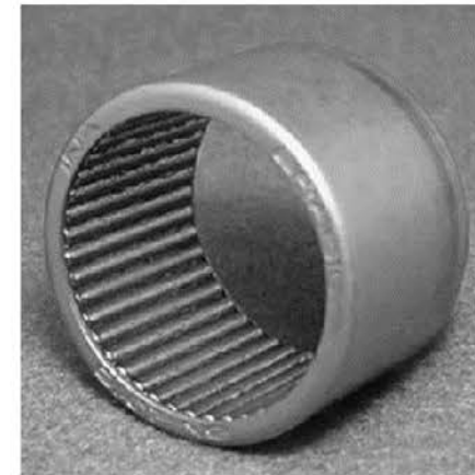
Rodamientos de dirección