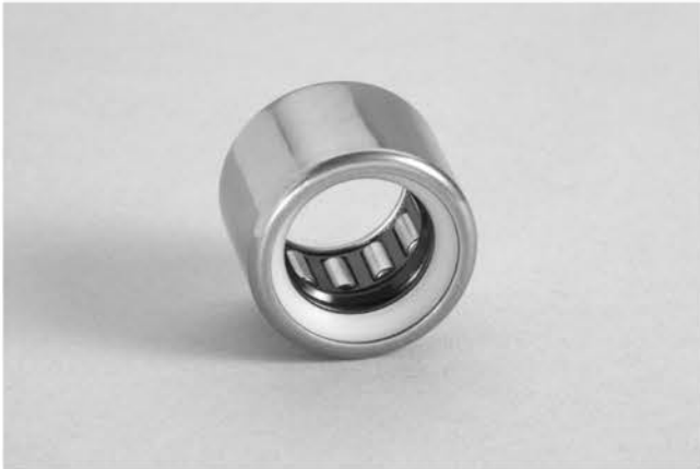
Rodamiento de directa