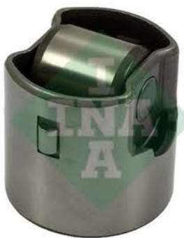
Elemento bombeante (combustible/agua)