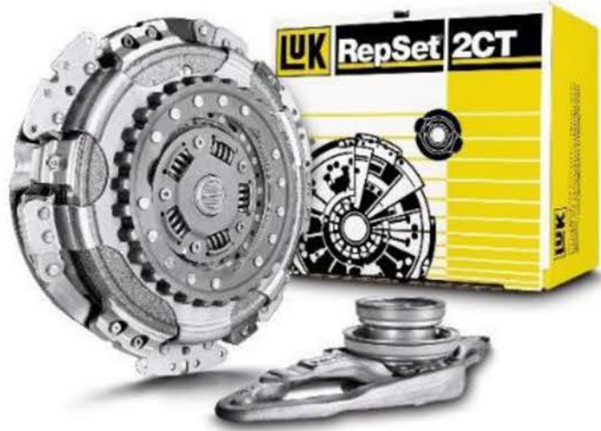
LuK RepSet 2CT