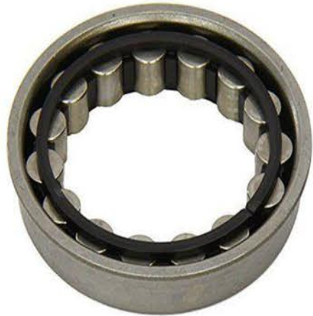
Componente de caja y diferencial (Linea liviana)