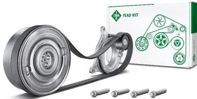
KIT de accesorios