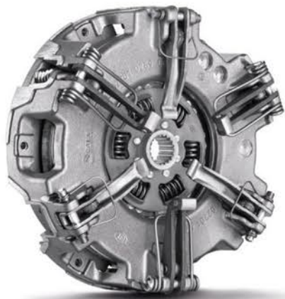
Placa de embrague pesados